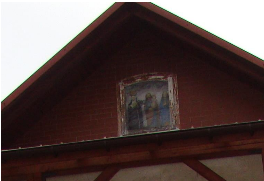
6. Kapliczka szafkowa na domu Sobczaków.