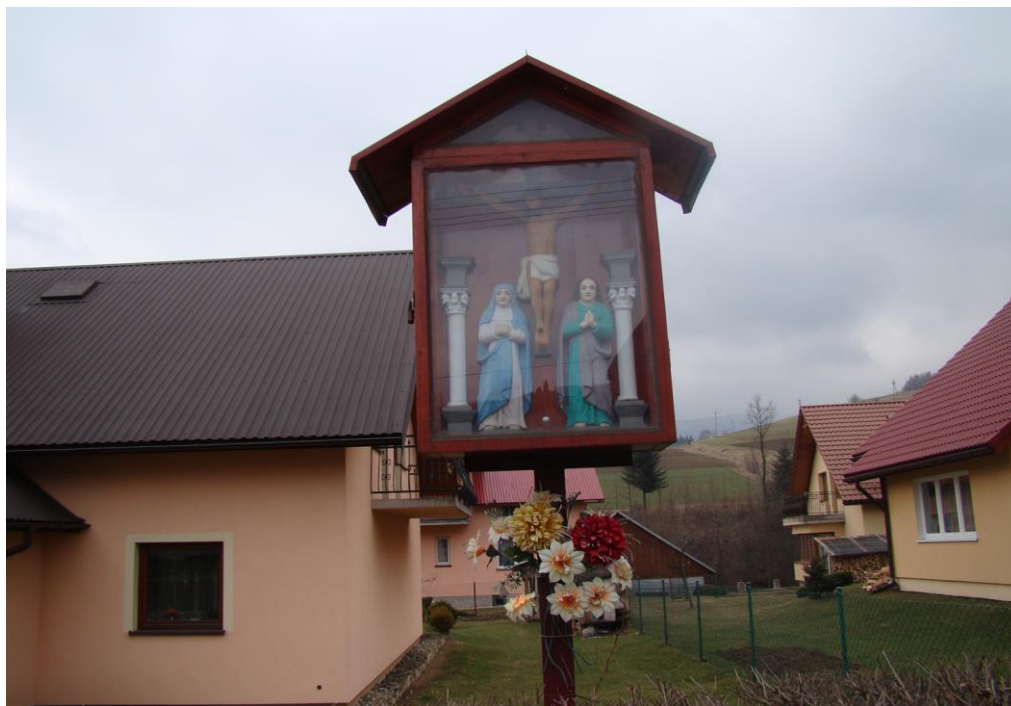
7. Kapliczka szafkowa na słupie na parc. Nr 13 W. Tomasiaka. Sprawiona w XVIII/XIX w. z fundacji rodziny Kuligów. Drewniana, bogato rzeźbiona, z ludowymi rzeźbami. Chrystusa Ukrzyżowanego między Matką Boską Bolesną i Św. Janem Ewangelistą. ; poniżej Twarz Chrystusa. Pierwotnie zawieszona na budynku, obecnie na słupie.