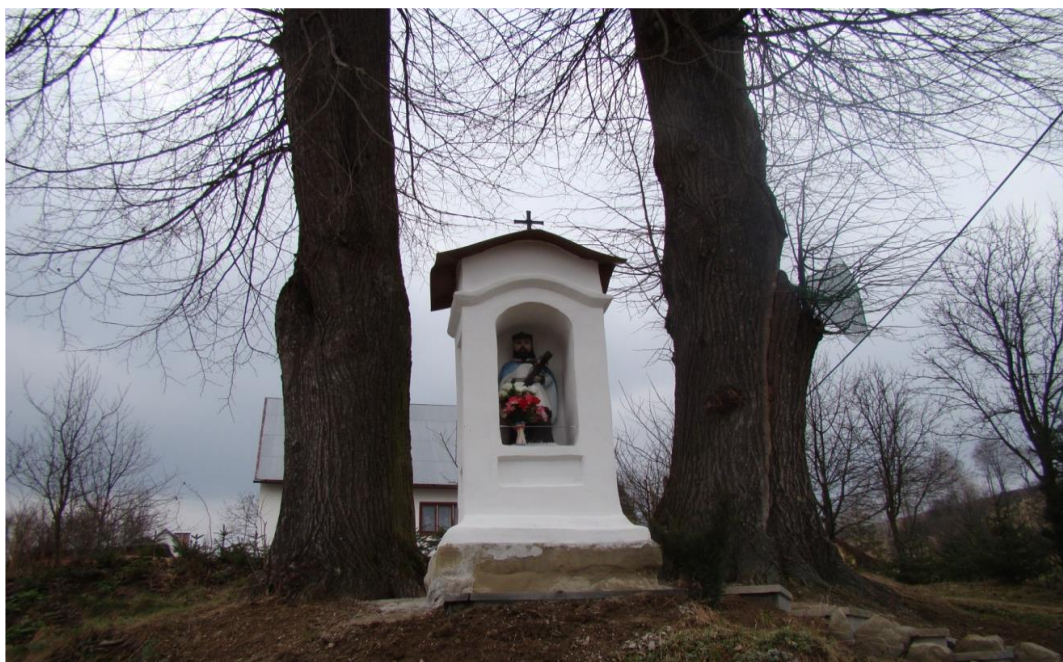
4. Kapliczka murowana w kształcie słupa na parceli gromadzkiej. Wzniesiona ok. poł. W. XIX, z fundacji okolicznych mieszkańców. Kamienna. Czworoboczna, otynkowana. W półkoliście zamkniętej wnęce ludowa rzeźba św. Jana Nepomucena.