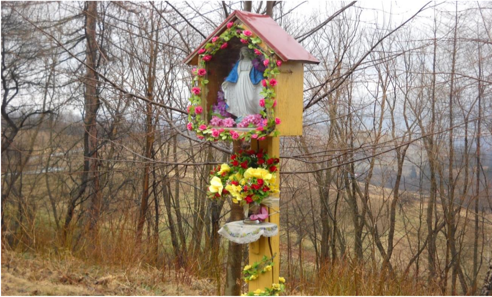
13. Współczesna kapliczka szafkowa na słupie na Twarożce.