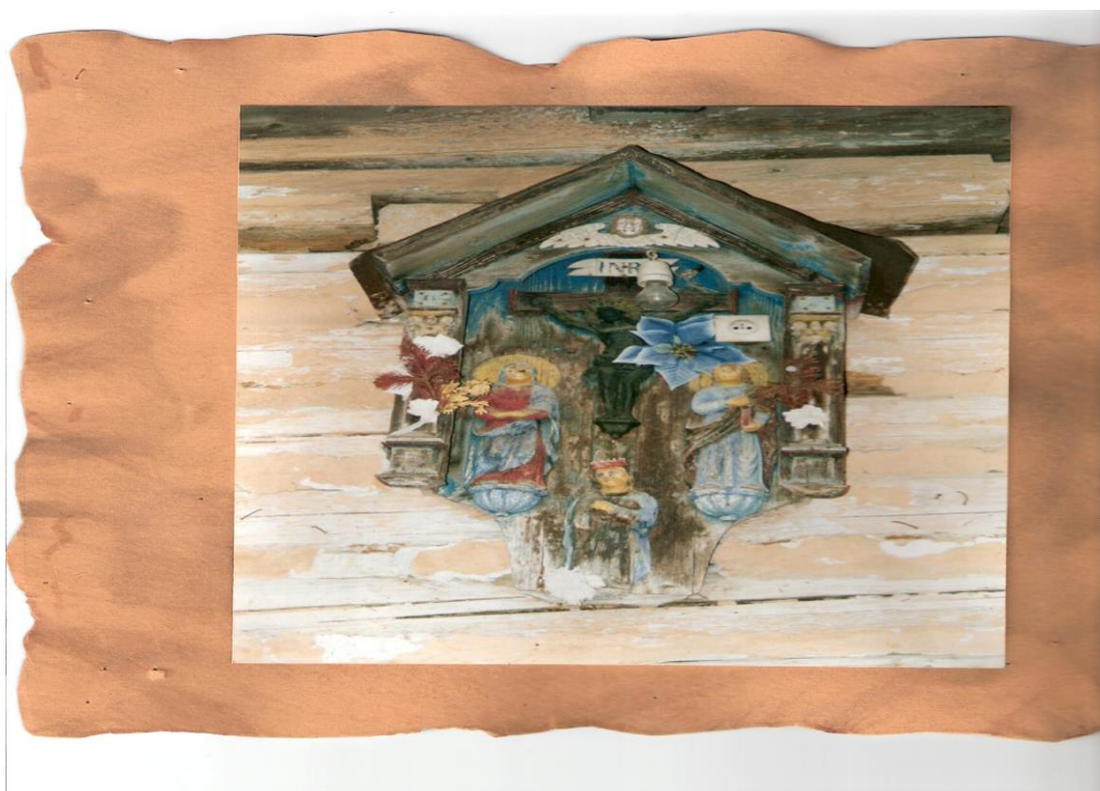
10. Kapliczka szafkowa na budynku nr na budynku nr. 32, A.K.Królów. Sprawiona w XIX z fundacji rodziny Królów. Drewniana, ozdobna, otwarta, z metalowym krucyfiksem, pod którym ludowe płaskorzeźby Matki Boskiej Bolesnej, św. Jana Ew. i u dołu św. Jana Nepomucena.