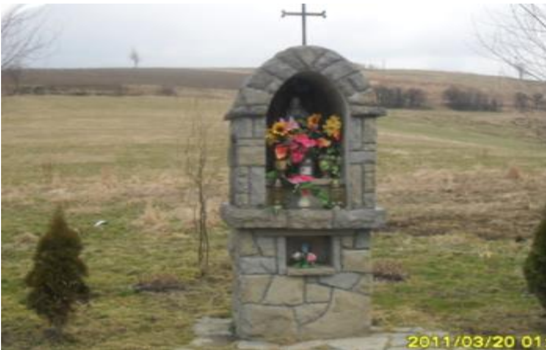
14. Współczesna kapliczka murowana w kształcie słupa na zagrodzie.