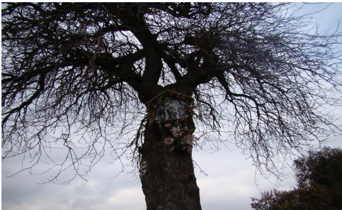
8. Kapliczka na starej gruszy przy drodze na rozstaju dróg Przysietnicy i Moszczenicy.