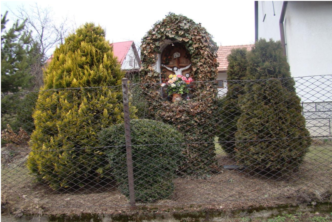
11. Kapliczka szafkowa na słupie parcela. E. Pawlika. Wzniesiona w XIX w. z fundacji rodziny Ogorzałych. Drewniana, otwarta, z blaszaną osłoną, w niej ludowe rzeźby Chrystusa Ukrzyżowanego oraz znacznie mniejsze Matki Boskiej, św. Jan Ew. oraz Piotra; w tle główki aniołków. Pierwotnie zawieszona na drzewie, obecnie na słupie, zakończonym kutym krzyżem.