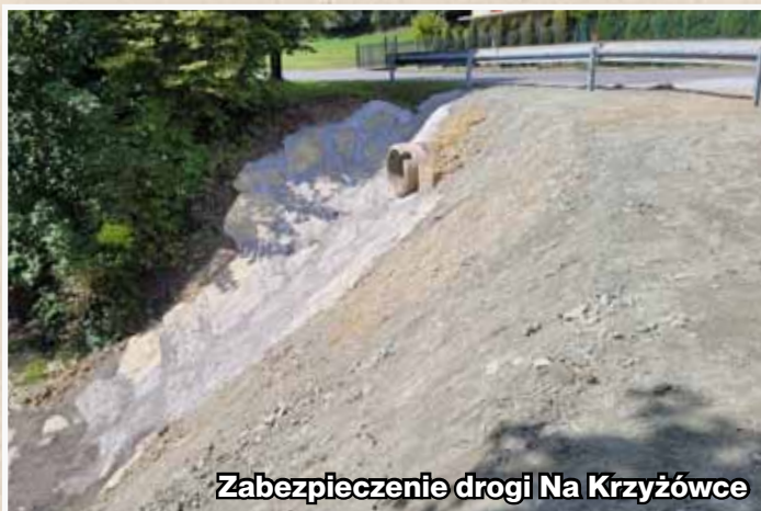
Zabezpieczenie drogi Na Krzyżówce

zmodernizowano blisko kilometr dróg za łączną kwotą około 0,9 mln złotych. W bieżącym roku wykonano projekty oświetlenia dróg Na Rówień i Na Targowisko, na które wydano 40 tys. złotych. Zabezpieczono oberwisko ziemne na Krzyżówce i wykonano dwa odcinki sieci kanalizacyjnej za kwotę 120 tys. złotych. Podsumowując: rok 2022 był w Przysietnicy bardzo dobrym rokiem inwestycyjnym. (W.W.)