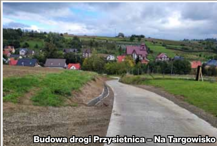
Budowa drogi Przysietnica – Na Targowisko