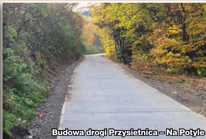
Budowa drogi Przysietnica – Na Potyle