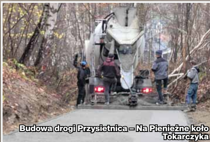
Budowa drogi Przysietnica – Na Pieniężne koło Tokarczyka