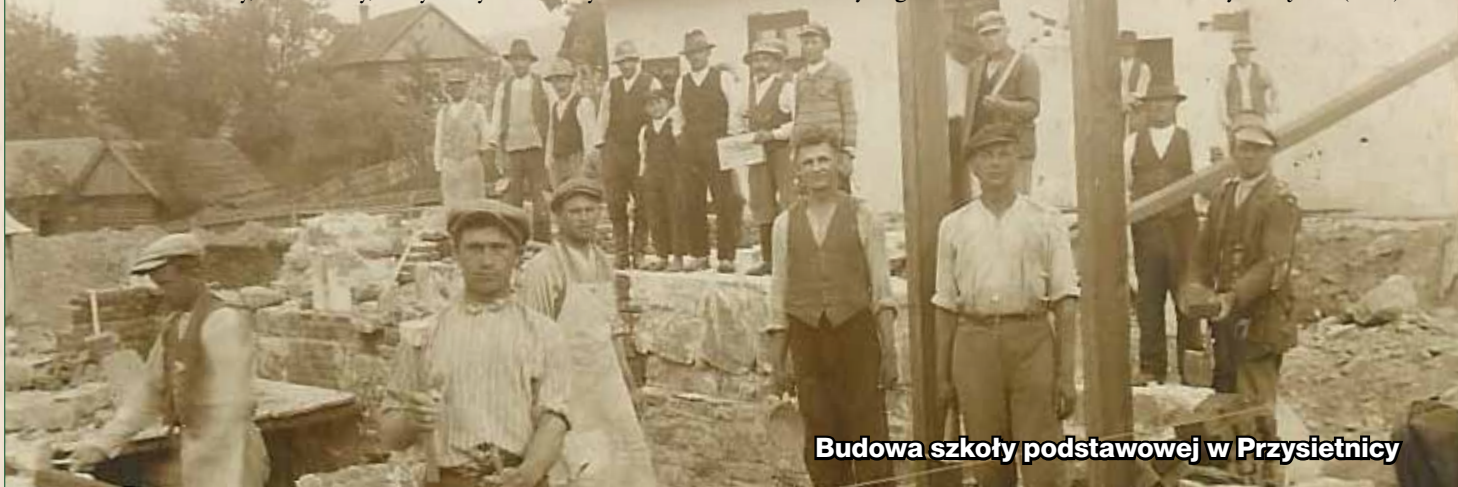
Budowa szkoły podstawowej w Przysietnicy

Po przejściu na emeryturę przeniósł się do Starego Sącza. Żyjące pokolenie uczniów kierownika Danielskiego wspomina go jako pracowitego, wymagającego pedagoga, bardzo oddanego nauczaniu, wychowaniu i pracy dla społeczeństwa. Spoczywa w rodzinnym grobowcu na cmentarzu w Starym Sączu. (Z.G.)